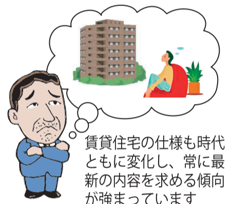
賃貸住宅の仕様も時代とともに変換し、常に最新の内容を求める傾向が強まっています

新築賃貸物件の設計担当者が「燃費のいい賃貸住宅」の性能を分かりやすく紹介。実際の物件で撮影することで、暮らしの中で感じられる快適性や光熱費削減といったメリットをよりイメージしやすくなっています。物件を探す若年層にも役立つ、住まい選びの新しい視点を提供する内容です。