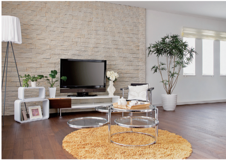
後半に入り、賑わいを見せている一方で、不安要因も浮上しています

23区で4カ月連続して全面積帯が最高値となりました。さらに、(株)LIFULL発表の「マーケットレポート2026年2月」の賃料動向でも、