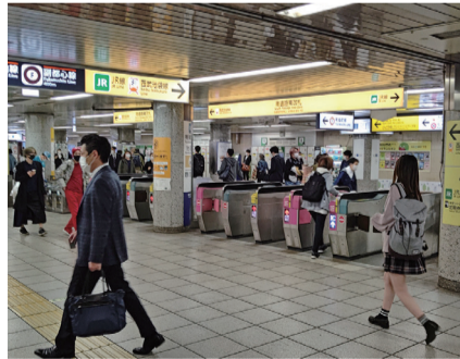
景気は弱めの動きながら、緩やかに回復しているようです

業界別で不動産DIは、前月比0・7ポイント増の48・2と2カ月連続で改善しました。