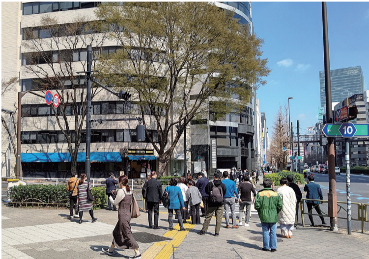
時代は速く、賃貸市場を取り巻く環境も急ピッチの動きを見せています。そんな中、新春の商談に来店されますお客様の出足は好調です

2024年11月の全国主要都市の「賃貸マンション・アパート」家賃動向(アットホーム調べ)では、マンションの平均募集家賃が、東京都下・神奈川県・埼玉県・千葉県などの7エリアの全面積帯で、前年同月