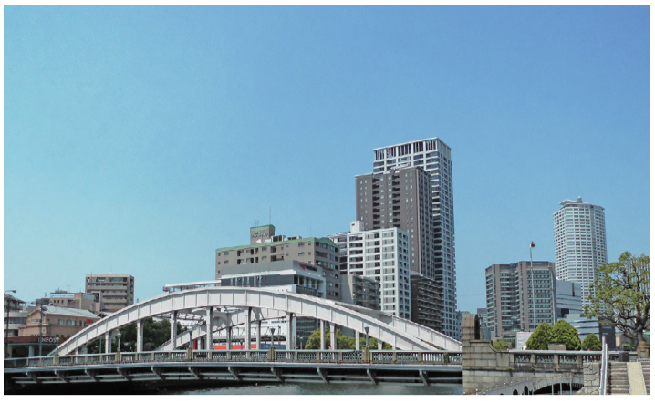
賃貸住宅にとっての「2025年問題」は、高齢者入居対応ではないでしょうか

不動産の「2025年問題」が昨年来、話題を呼んでいます。「団塊の世代」が高齢化することで、不動産全体に影響を及ぼす「問題」なのですが、当然、賃貸住宅にも関係してきます。