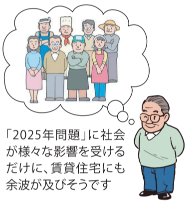
「2025年問題」に社会が様々な影響を受けるだけに、賃貸住宅にも余波が及びそうです

この物流の2024年問題から派生して、賃貸住宅の設備で「宅配ボックス」設置の要望が高まり、さらに、デジタル化の進展とともに「スマート置き配」