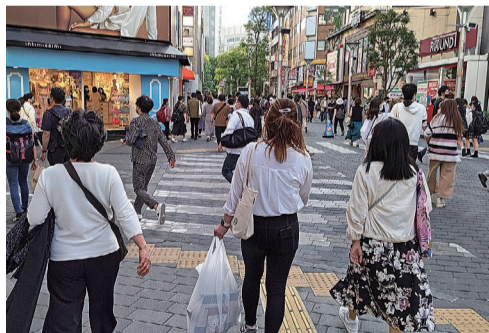
景気は為替とコスト負担の行方に、大きく左右されそうです

「貸家は、富裕層の相続税対策需要が強いほか、企業が安定収益源の獲得を目的として、中規模賃貸マンションを購入する動きもみられる(神戸)」、「価格が高いため持家の購入を断念した世帯が、より良い住環境を求めて築古のアパートから