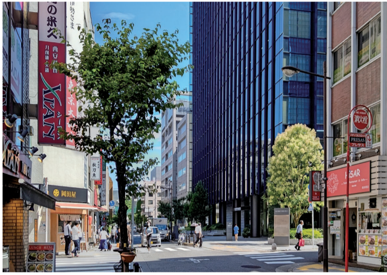
活発な不動産事業に合わせて、土地価格の上昇が各地で見られます。今後、不動産投資に先行する価格の動向が注目されます

また、相続税や贈与税の算定基準となり、土地価格相場に影響を及ぼす令和6年分の「路線価」は、全国平均で前年比プラス2.3%となり、3年連続で上昇しました。