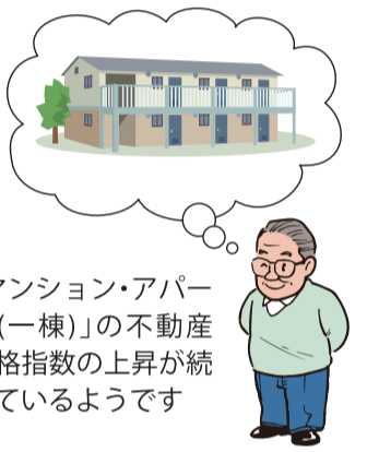
「マンション・アパート(一棟)」の不動産価格指数の上昇が続いているようです

フアミリー向きが7カ月連続して全13エリアで前年同月を上回り、中でも、埼玉県・千葉県・名古屋市などの8エリアは2015年1月以降、最高値を更新。アパートも、フアミリー向きが全13エリアで前年同月を上回り、東京23区などの3エリア