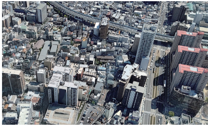
賃料の上昇傾向が、このまま秋の商戦まで続くか気になるところで

暑い毎日が続きますが、立秋を過ぎれば秋の気配も感じられ、朝夕は涼しくなると思われれます。そして、お盆明けから「秋の賃貸ビジネス」がスタートを切ります。現在の市場の様子を見ておきます。