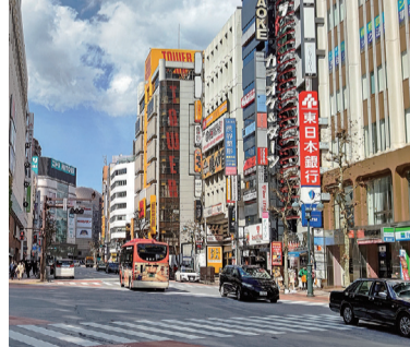
景気は現状、先行きともに、一服感が広がっています

「不動産情報ライブラリ」 スマホやタブレットから 複数のデータを地図に重ねて閲覧 オープンデータ等を活用して、価格、周辺施設、防災、都市計画などの情報を重ね合わせて表示する『不動産情報ライブラリ』(国土交通省)の運用が4月1日より、無料公開で始まっていますが、運用から1カ月を経て人気を呼んでいます。