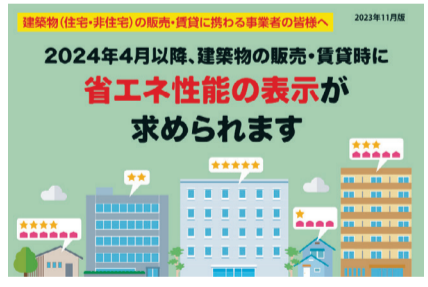
※国土交通省ホームページより

4月以降、事業者は新築建築物の販売・賃貸の新聞・雑誌広告、チラシ、パンフレット、インターネット等の広告において、努力義務ながら省エネ性能の表示ラベルの表示が求められます。ただし、新築以外の既存建築物についても表示は推奨されますが、表示しない場合の勧告等の対象とはなりません。当面は努力義務といっても、物件広告の省エネ性能に関する「エネルギー消費性能」「断熱性能」「目安光