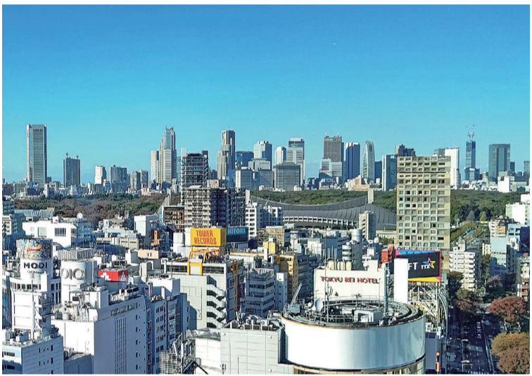
賃貸市場の強気の上向き傾向は、物件内容によって違いは明白で、家賃設定にも二極化のフェーズを強めています

景気動向については、内閣府や帝国データバンク発表の調査結果(「賃貸マーケット情報」参照)でも、「景気は緩やかな回復基調が続いているもの(一服感がみられる)」「景気ウオッチャー調査」と、幅広い圈内