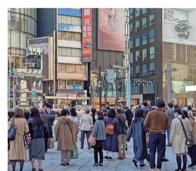
緩やかな回復基調が続いている景気も、横ばい圏で推移しています

『景気ウォッチャー調査』判断DIは2カ月ぶりの上昇 緩やかな回復基調の中、「一服感」 内閣府が公表する景気調査「街角景気」の直近の「景気ウォッチャー調査」(令和6年2月)によると、3カ月前と比較しての景気の現状に対する判断DIは、51・3と前月を1・1ポイント上回り、2カ月ぶりの上昇です。 また、2~3カ月前の景気の先行きに対する判断DIは、53と前月を0・5ポイント上りました。 景気ウォッチャーの見方は、「景気は、緩やかな回復基調が続いているものの、「一服感」がみられる。また、令和6年能登半島地震の影響もみられる。先行きについては、価格上昇の影響等を懸念しつつも、緩やかな回復が続くとみている」とまとめられています。 『地価LOOKレポート』 主要都市の地価は全ての地区で上昇または横ばいが継続 国土交通省が公表した、「令和5年 第4四半期地価LOOKレポート」によると、主要都市の高度利用地等における地価動向は、5期連続で全ての地区において上昇または横ばいとなりました。 景気が緩やかに回復している中、利便性や住環境に優れた地区におけるマンション需要が堅調であることに加え、店舗需要の回復傾向が継続したことなどにより、上昇したものです。 住宅地では7期連続で23地区全てにおいて上昇し、商業地では人流の回復を受け、店舗需要の回復傾向が継続したほか、オフィス需要が底堅く推移したことなどから、上昇傾向が継続しました。 『TDB景気動向調査(全国)』 夏以降から緩やかに持ち直すと思われる (株)帝国データバンクが発表した2月調査の『TDB景気動向調査(全国)』によると、2月の景気DIは前月比0・3ポイント減の43・9となり、2カ月連続で悪化。 国内景気は、株式相場など金融市場が好材料となったものの、消費者の節約志向の高まりなどが悪材料となり、小幅ながら悪化傾向が続きました。 業界別の不動産DIは、前月比0・2ポイント増の48・3。2カ月連続で改善しました。 今後の景気は、悪材料が集中して下振れるが、夏以降から賃上げなど個人消費を中心に緩やかに持ち直すと思われる。