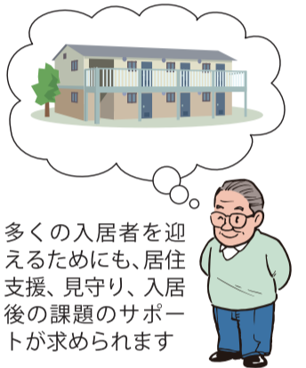
多くの入居者を迎えるためにも、居住後の課題のサポートが求められます

宅を提供しやすく、要配慮者が円滑に入居できる市場環境の整備」「居住支援法人等が入居中サポートを行う賃貸住宅の供給促進」「住宅施策と福祉施策が連携した地域の居住支援体制の強化」を三つの柱として推進する方針です。