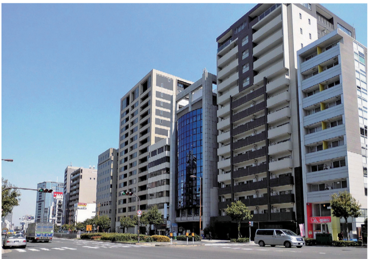
都心エリアや駅近物件の人気回復、賃貸ニーズの増加などが相まって、賃貸市場全体を押し上げているようです

表した「LIFULL HOME E、Sマーケットレポート2023年10~12月期 概要編」では、東京23区のシングル向き賃貸物件の掲載平均賃料は、12月時点で前年比105・6%となるなど、2023年10~12月期はコロナ禍だった2021年頃から5千円程度高い水準を維持しているとしていいます。直近のアンケートの家賃傾向を見ると、2024年1月の全国主要都市の「賃貸マンション・アパート」募集家賃動向(アットホーム調べ)では、マ