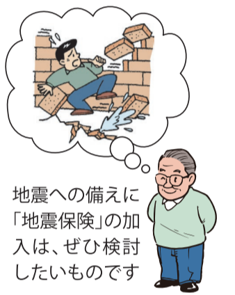
地震への備えに「地震保険」の加入は、ぜひ検討したいものです

一般的に居住用の建物、家財を対象とする火災保険には、住宅総合保険、住宅火災保険、店舗総合保険などがありますが、こうした保険は地震が原因の火災による損害は対象外です。そのため地震による火災・