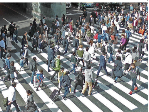
実際に大地震など自然災害の被害に遭遇すると、平時と違った解約手続きや修繕義務の有無あるいは被害内容の取り扱いは、