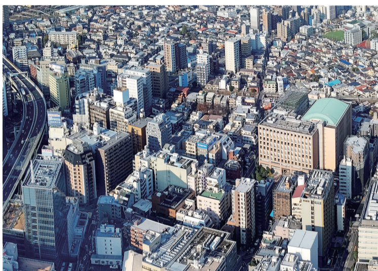
賃貸市場が活気づく中、新設着工戸数、不動産価格指数、収益物件市場に変化の兆しが見られます

賃貸経営に直結するアパート・マンションの家賃の傾向ですが、2023年11月の全国主要都市の「賃貸マンション・アパート」募集家賃動向(アットホーム調べ)によると、マンションの平均募集家賃が、東京23区・東京都下・埼玉県・千葉県・名古屋市などの8エリアの全面積帯で、前年同月を上回っています。アパートについては神奈