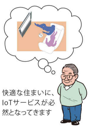
快適な住まいに、IoTサービスが必然となってきます

ニッチな手法を生かし、狙ったコンセプトを前面に打ち出した「コンセプト型賃貸住宅」の開発が各地で続いています。同様に、時代を先取りする最新の「スマート賃貸住宅」の展開が急速に広がっています。スマートハウスとは、「家庭内のエネルギー機器、自動車、家電機器、住設機器を相互に連携させることで、より効率的なエネルギー利用と機器連携を通じた新たな価値を提供することができる住宅」(経済産業省)を指し、エネルギー使用の効率化を打ち出した住宅といえます。当初は省エネ、節電に注力した商品開発に重点が置かれていたのが、単なるエネルギーの効