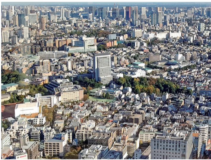
新年を迎え、コロナ禍からの回復基調が本格化し、さらなる成長に期待が集まっています

それだけに、お気に入りの賃貸住宅を求める傾向は今後さらに強まると見られます。そこで入居者ニーズに合わせるために、コンセプト型賃貸住宅をはじめ、LCCM(エルシーシーエム)賃貸住宅、スマートハウス賃貸住宅など次世代型賃貸住宅の広がりが見込まれるものです。令和6年は既築賃貸住宅のリフォーム・高機能設備の導入が活発になると予想されます。